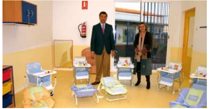
El Alcalde y la delegada de Bienestar Social de la Junta de Andalucía.