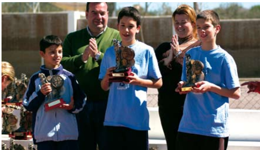
Entrega de trofeos en la pasada edición de la Carrera Popular Tierra y Olivar.

Como viene siendo habitual, la altísima participación registrada en anteriores ocasiones no ha sido una excepción en esta edición de la carrera, que ha contado con un amplio número de corredores de todas las categorías: infantil, cadetes, seniors. Al final de la jornada se repartieron trofeos a los tres primeros participantes de cada categoría en general y a los tres primeros participantes de cada categoría empadronados en Salteras. Asimismo, se entregó un pre-