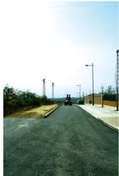
Avenida del Junquillo.

presupuesto. En concreto, la nueva avenida estará dotada de una moderna luminaria, al igual que en la travesía, y una mediana en la que se han ubicado plantas