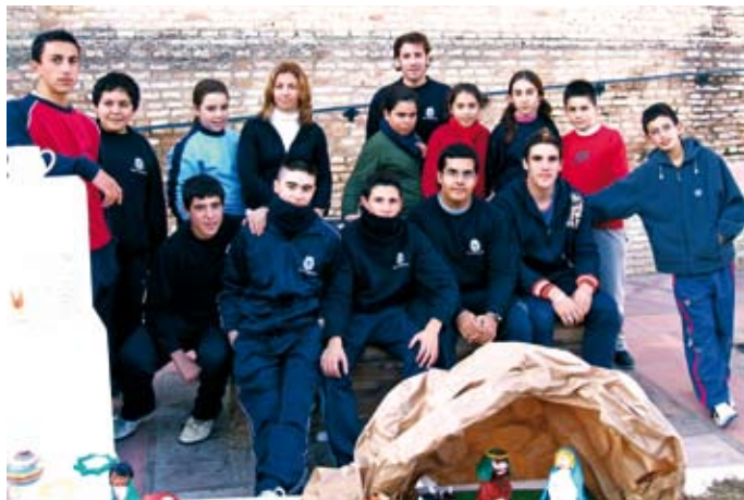
El Proyecto Ribete es una de las alternativas de formación y ocio más populares de Salteras. En la imagen, los alumnos de uno de los talleres que se imparten.