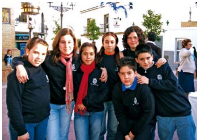
Varios alumnos de Proyecto Ribete junto en la Plaza de España en una de las actividades llevadas a cabo por esta iniciativa municipal.