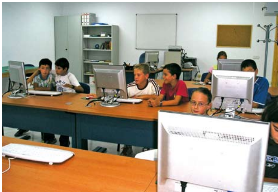
Los niños disfrutaron de una divertida sesión informativa.

El Ayuntamiento de Salteras ha aprovechado la celebración del Día Mundial del Consumidor para llevar a cabo una serie de actividades encaminadas a informar a los ciudadanos sobre sus derechos y sus deberes como consumidores.