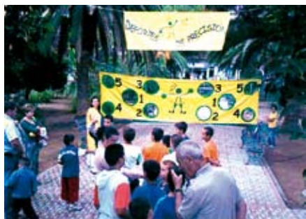
Fútbol-precisión, una de las actividades de la fiesta.

El Ayuntamiento de Salteras quiere transmitir a los jóvenes que, para pasar un buen rato y disfrutar del tiempo libre, no es necesario ingerir alcohol u otras sustancias tóxicas. Por ello, llevará a cabo una gran fiesta dirigida a la juventud el 11 de mayo en la explanada del Salón Multiusos del Ayuntamiento, desplegando, para la ocasión, un amplio repertorio de actividades deportivas y lúdicas.