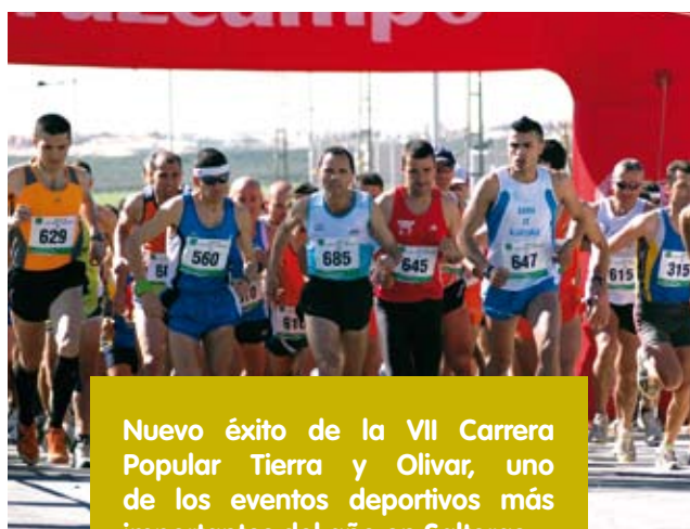
Nuevo éxito de la VII Carrera Popular Tierra y Olivar, uno de los eventos deportivos más importantes del año en Salteras.