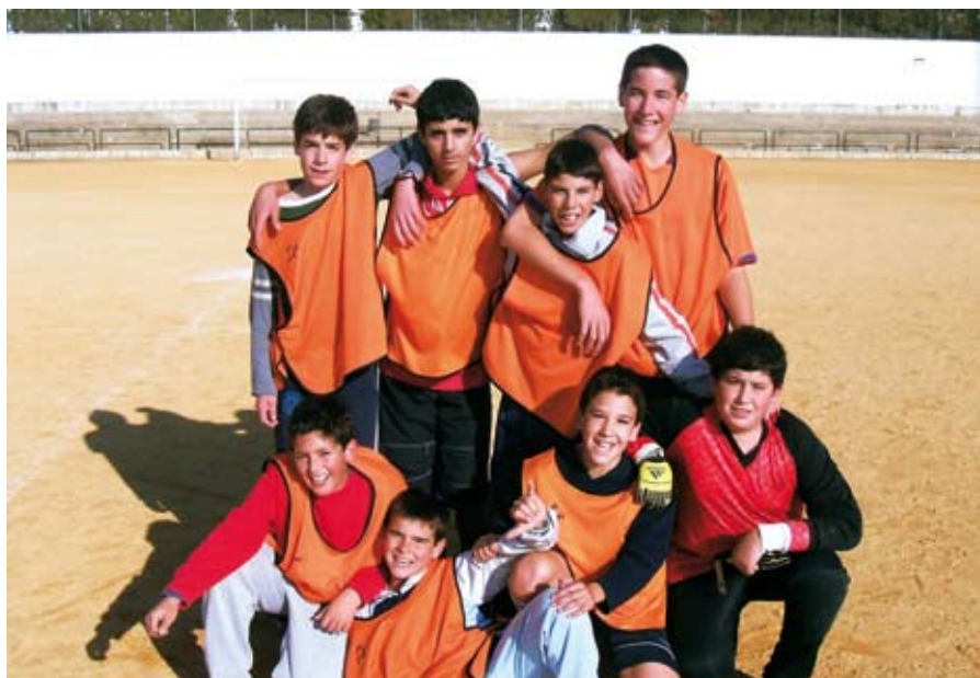
Aprovechar el tiempo libre de una forma sana y saludable es también uno de los objetivos principales de Proyecto Ribete, que organiza diferentes actividades deportivas.

En concreto, en el taller de electricidad se podrá aprender a montar circuitos y hacer pequeños arreglos en los electrodomésticos