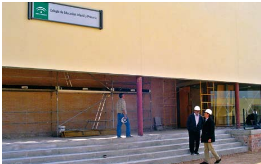
El Alcalde observa el avanzado estado de las obras del nuevo colegio.