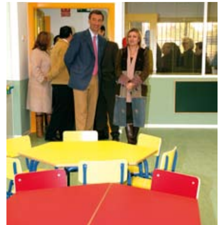
Aspecto de las nuevas aulas de la guardería.

El patio cuenta, además, con más de 300 metros cuadrados. Sin duda, el edificio está a la altura de las necesidades de nuestro municipio en cuanto al apoyo a las familias y,