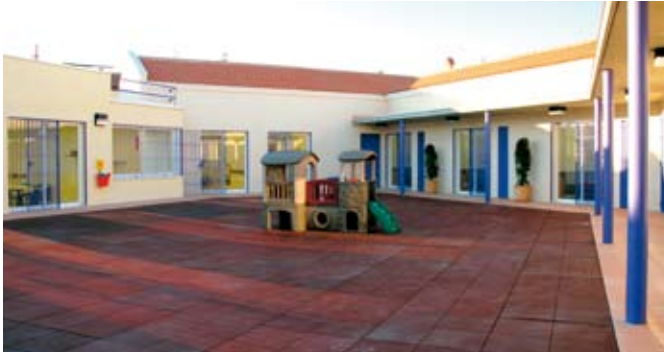
Aspecto que presenta el patio de la nueva guardería municipal.