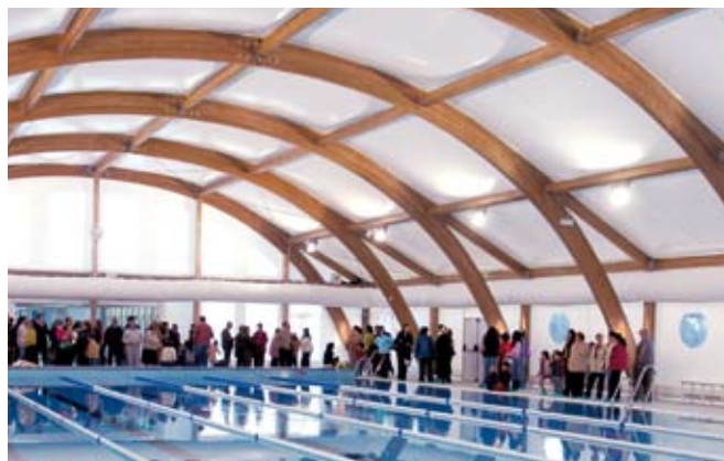
Inauguración multitudinaria de la nueva piscina cubierta.

Más de 150 personas acudieron el pasado día 21 de febrero a la inauguración de la nueva piscina cubierta de Salteras. No en vano, se trata de uno de los proyectos más ambiciosos del actual equipo de Gobierno que se convertirá, sin lugar a dudas, en uno de los referentes deportivos de la comarca del Aljarafe.