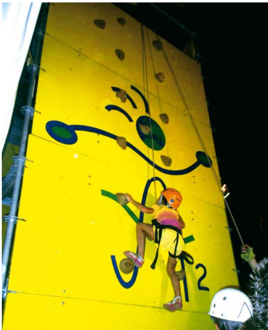
El rocódromo, una de las alternativas de ocio propuestas para los jóvenes.

Además, se llevarán a cabo talleres manuales de atrapasueños, maquillaje y tatuajes para aquellos que prefieran actividades más didácticas y creativas.