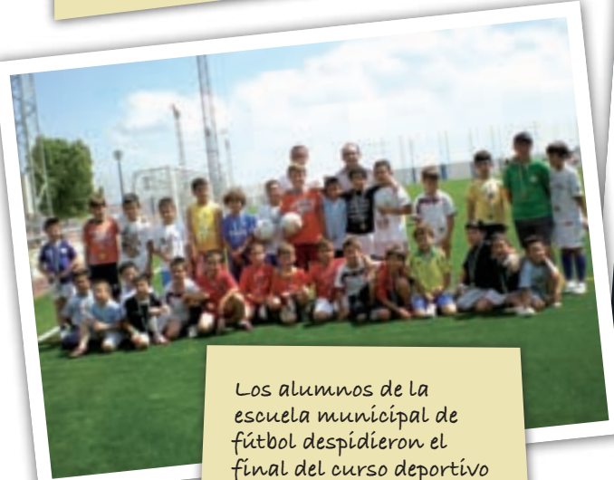
Los alumnos de la escuela municipal de fútbol despidieron el final del curso deportivo 2007-2008.