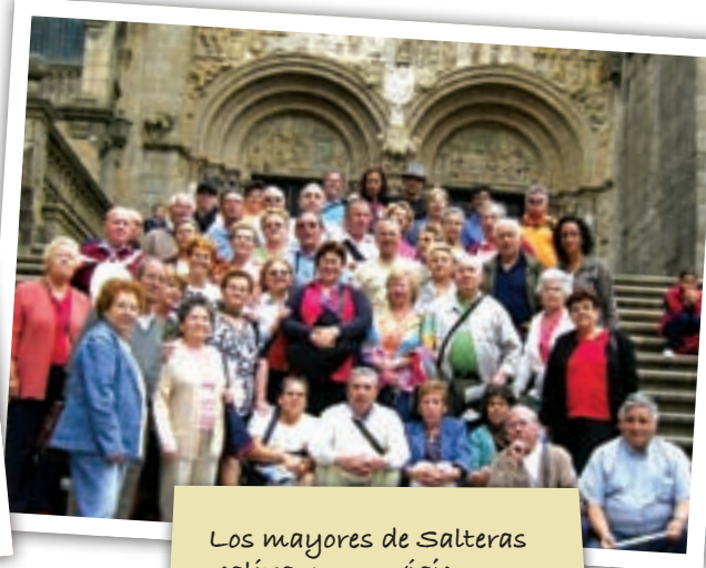
Los mayores de Salteras realizaron un viaje a diferentes puntos de Galicia y Zamora durante el mes de junio.