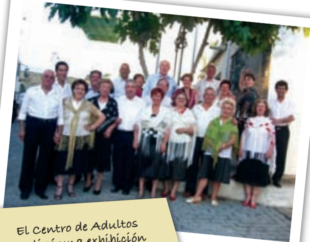
El Centro de Adultos realizó una exhibición de bailes de salón en la clausura de los Talleres Culturales.