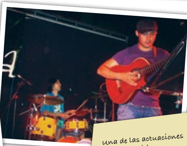
Una de las actuaciones musicales del programa "Verano Cultural 2008".