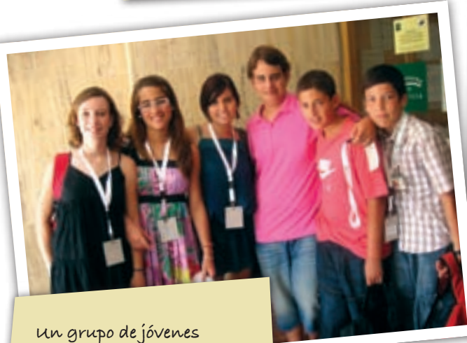
Un grupo de jóvenes saltereños participaron en la clausura del programa "Parlamento Joven".