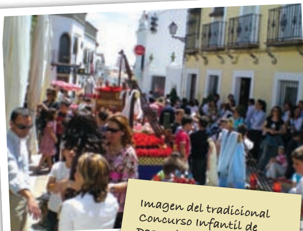
Imagen del tradicional Concurso Infantil de Pasos de Cruz de Mayo durante las fiestas de Salteras.