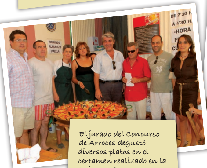
El jurado del Concurso de Arroces degustó diversos platos en el certamen realizado en la Feria 2008.