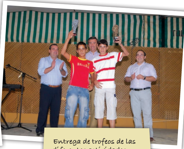
Entrega de trofeos de las diferentes actividades deportivas organizadas con motivo de la Feria.