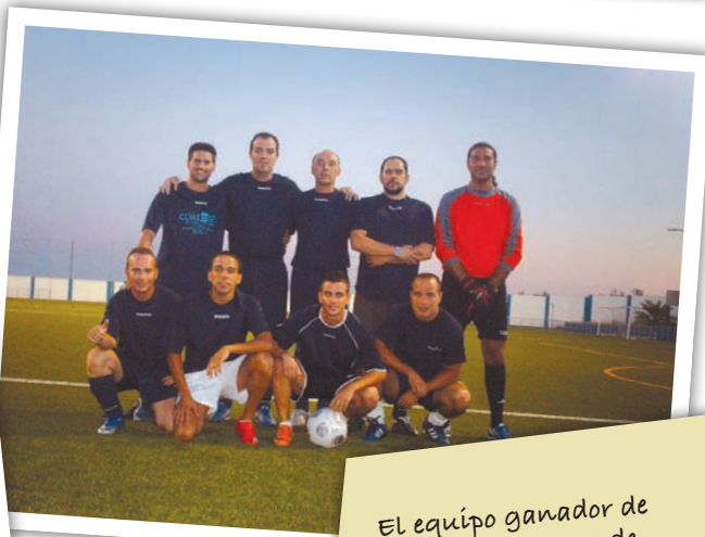
El equipo ganador de la Liga de verano de aficionados disputada durante la época estival.