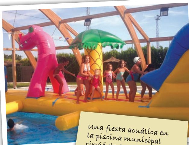
Una fiesta acuática en la piscina municipal sirvió de despedida a las actividades de la temporada de verano.