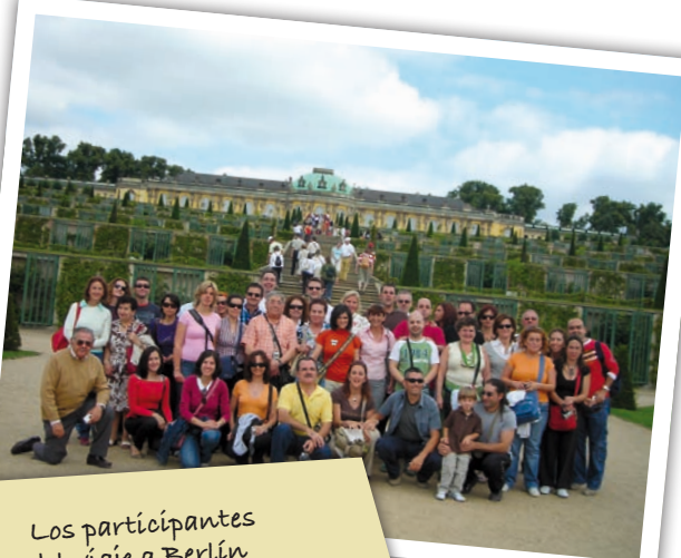
Los participantes del viaje a Berlín disfrutaron de diversas visitas culturales y monumentales.