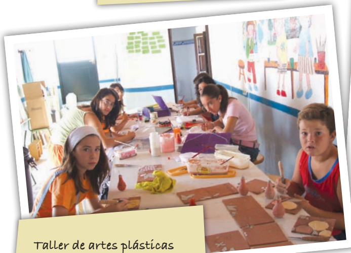
Taller de artes plásticas desarrollado a través del Proyecto Ribete de la Delegación de Bienestar Social.