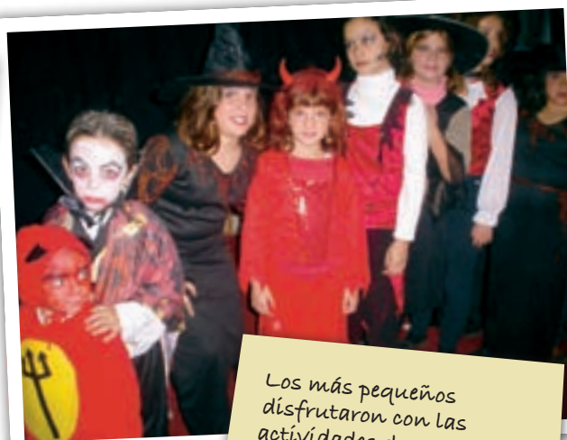
Los más pequeños disfrutaron con las actividades de Halloween organizadas por la Biblioteca Municipal.