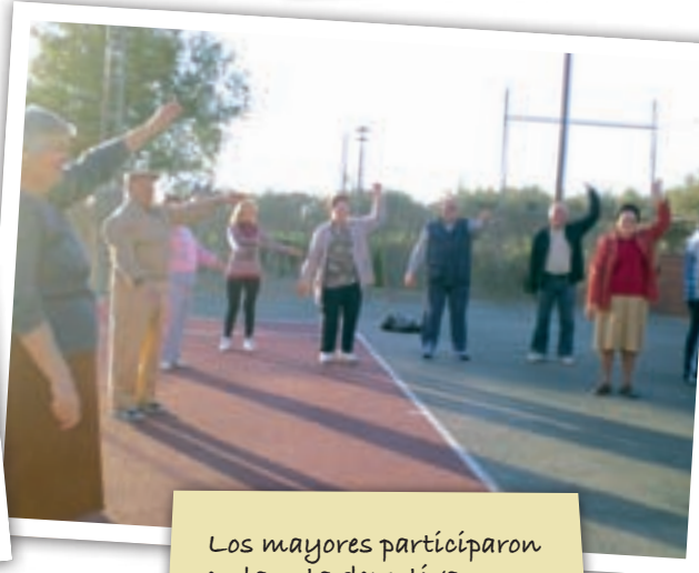
Los mayores participaron en la ruta deportiva enmarcada en el nuevo programa "Salteras en marcha".