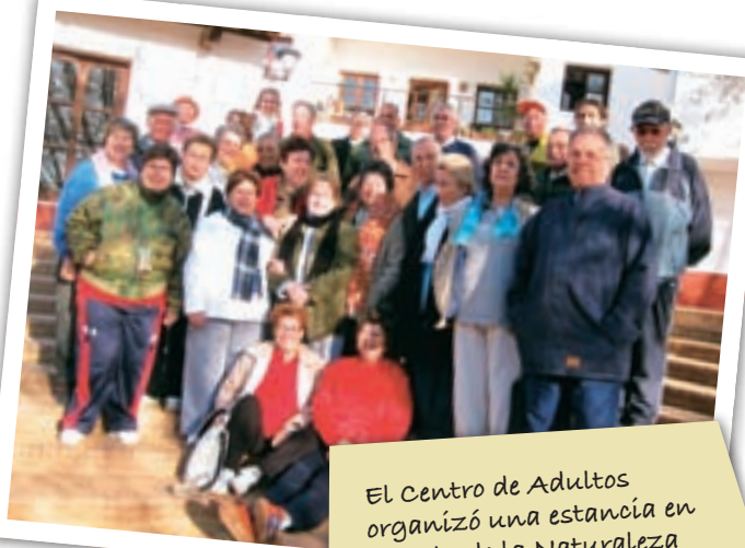
El Centro de Adultos organizó una estancia en el Aula de la Naturaleza El Remolino, en Cazalla de la Sierra.