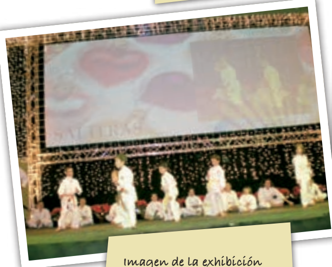
Imagen de la exhibición de la escuela de karate de Salteras en la Muestra "Sevilla Son Sus Pueblos".