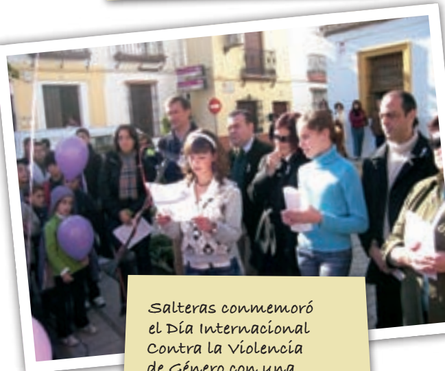
Salteras conmemoró el Día Internacional Contra la Violencia de Género con una concentración en la Plaza de España.