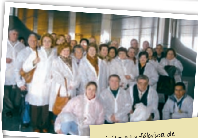
Visita a la fábrica de Heineken en Sevilla (antigua Cruzcampo) organizada por la Delegación de Consumo durante Navidad.