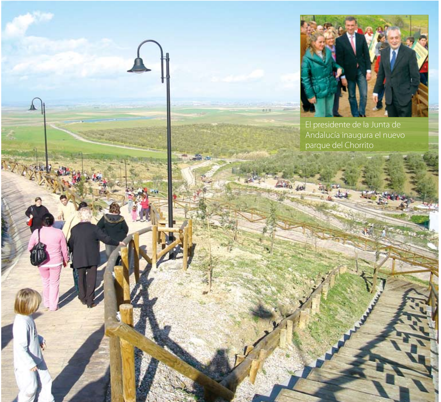
El presidente de la Junta de Andalucía inaugura el nuevo parque del Chorríto

Marzo 2010 nº20 / Publicación Trimestral Gratuita. Excmo. Ayuntamiento de Salteras