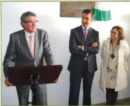
Inauguración del consejero de Gobernación, Luis Pizarro