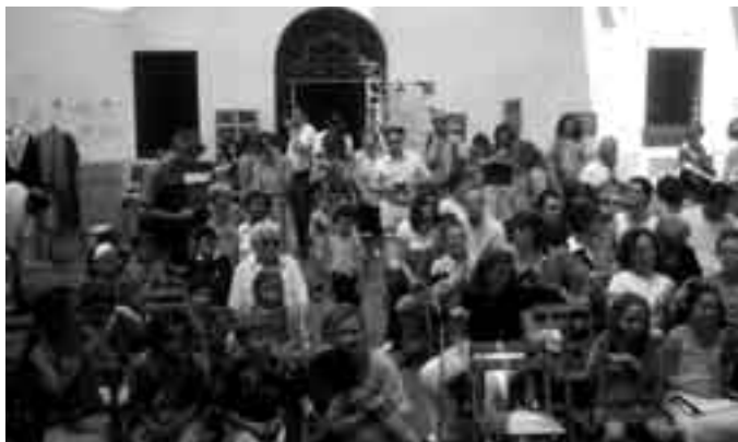
Las actividades organizadas atrajeron un gran número de espectadores.