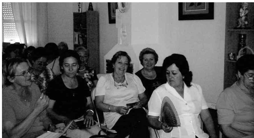
Numerosas saltereñas se congregan en el Aula Jurídica para recibir asesoramiento en materia de consumo.

Desde el C.I.M., y en colaboración con la Asociación de Mujeres Afán XXI, se desarrolló en el mes de mayo una nueva sesión del AULA JURÍDICA que ha contado con la colaboración del Técnico de la Oficina Municipal de Información al Consumidor. En dicha aula, las participantes recibieron asesoramiento en materia de consumo de bienes y servicios, en los derechos que las asisten, las posibilidades y formas de reclamación que pueden llevarse a cabo a través de las hojas de reclamaciones e información sobre el sistema arbitral de consumo.