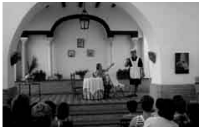
En la imagen, una de las escenas de teatro vividas recientemente.