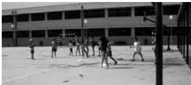
Los niños se divierten de mil maneras en las instalaciones deportivas.

Una vez finalizados los actos y la exhibición, los padres se marcharon dejando solos a los niños, que disfrutaron de la piscina, bañándose y jugando, custodiados por dos socorristas, por sus monitores y los padres voluntarios, a quienes les agradecemos su colaboración. ¡OS ESPERAMOS EL PRÓXIMO AÑO!