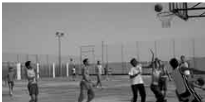
El baloncesto es un deporte con mucho 'gancho' entre los jóvenes saltereños.