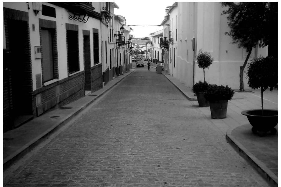
La calle Nuestra Señora de la Oliva ha sido una de las que el Ayuntamiento ha arreglado recientemente.

Tal y como se anunció en el número anterior de nuestra revista, el Ayuntamiento ha procedido a reformar y condicionar las calles Virgen de los Reyes, Maestro Chico Morales, Aljarafe, Virgen de la Oliva y Niño Practicante. Realmente, las dos últimas calles se han realizado en un tiempo récord.