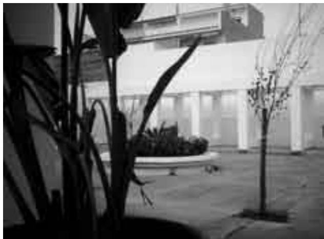
Vista parcial de la Plaza de los Álamos.