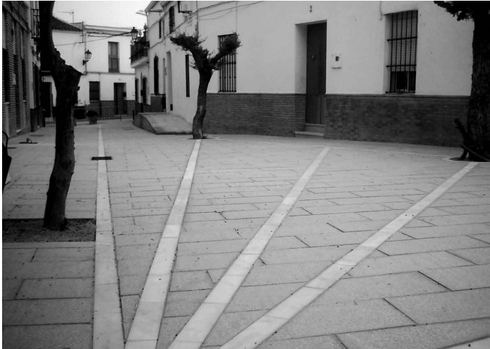
Perspectiva del nuevo acerado de la calle Niño Practicante.