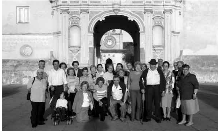
Una de las actividades fue la visita al Centro Andaluz de Arte.