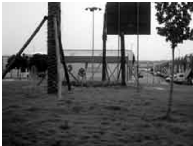
Detalle de la zona verde de San Benito.

Nuestra escuela taller está ultimando las instalaciones que se van a acometer en el parque central Casa Grande así como las plantaciones en esta zona. Por ello, queremos felicitar, desde esta revista y en nombre de todos los saltereños y saltereñas, a los jóvenes profesionales de esta escuela, que han demostrado su valía dotando a esta urbanización de un excelente recinto que será disfrutado por pequeños y mayores.