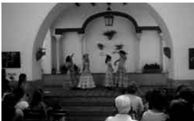
Las más pequeñas enseñaron sus dotes como bailaroras en la Casa de la Cultura.