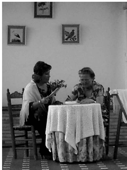
En la imagen, una de las actuaciones de teatro llevadas a cabo en la Casa de la Cultura.

Por otra parte, durante la segunda quincena de junio, se instaló una exposición titulada "La Palabra Pintada", que albergó una colección de 12 grabados de autores sevillanos que glosan, desde sus respectivos trabajos, poemas de poetas españoles. La muestra se ubicó en el Salón de Plenos del Ayuntamiento.