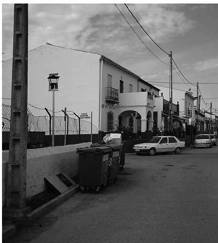
Detalle de la calle Aljarafe.

Todas las actuaciones que el equipo de Gobierno está llevando a cabo para el acondicionamiento de las calles de la localidad se están traduciendo en un impulso para la transformación de nuestro pueblo que se estaba haciendo necesario desde hace varios años debido al crecimiento de nuestra localidad.