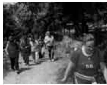
El día fue idóneo para llevar a cabo una ruta de estas características.