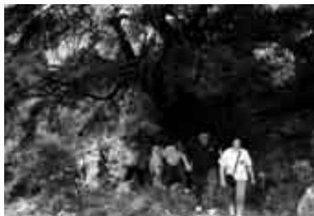
La ruta es de dificultad nivel bajo-medio.