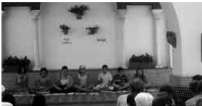
El entusiasmo de los chavales se palpaba en todas sus actuaciones.

La Casa de la Cultura ha sido escenario de numerosas actuaciones protagonizadas por los más pequeños