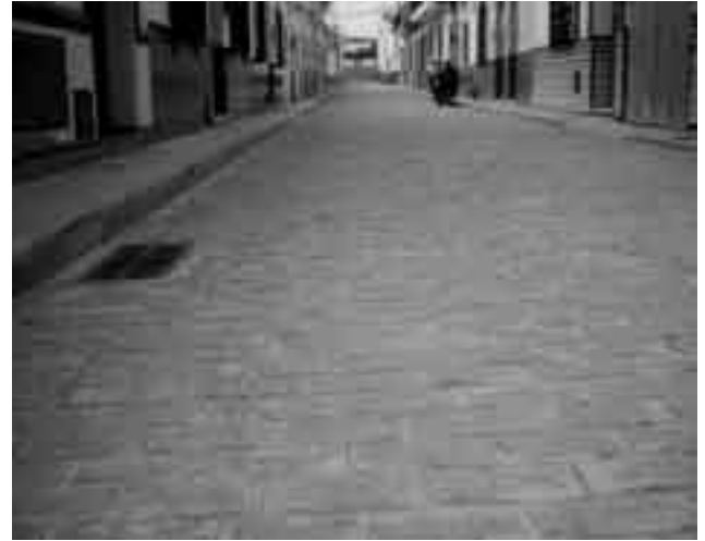
Detalle de la calle Maestro Chico Morales.