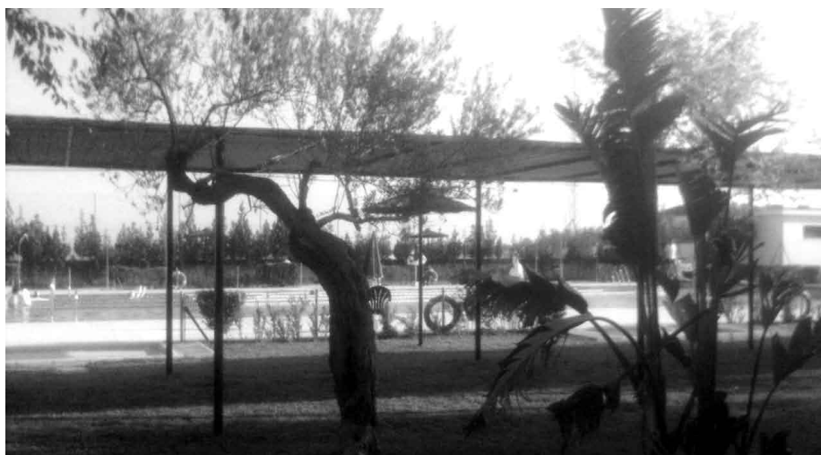
La piscina dispone de amplias zonas verdes.

La piscina está dotada con todo tipo de medidas de seguridad y equipamientos