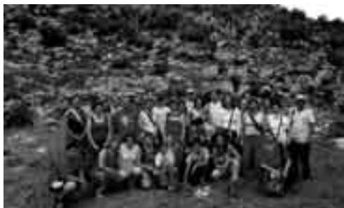
En la imagen, los participantes de esta excursión a la Sierra de Grazelema.