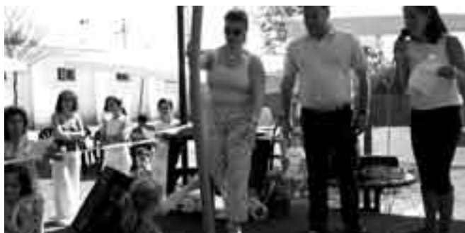
Acto de entrega de diplomas.