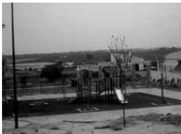
Estado actual del parque central Casa Grande.

Los chicos y chicas de esta escuela serán referente para otros jóvenes que, en un futuro, quieran participar en una escuela taller, ya que muchas de las actuaciones que han realizado han permitido mejorar nuestro pueblo, recuperando varios de los rincones olvidados de la ciudad y convirtiéndolos en bellos enclaves, entre los que se encuentra también la Plaza de los Álamos y la zona verde de San Benito.