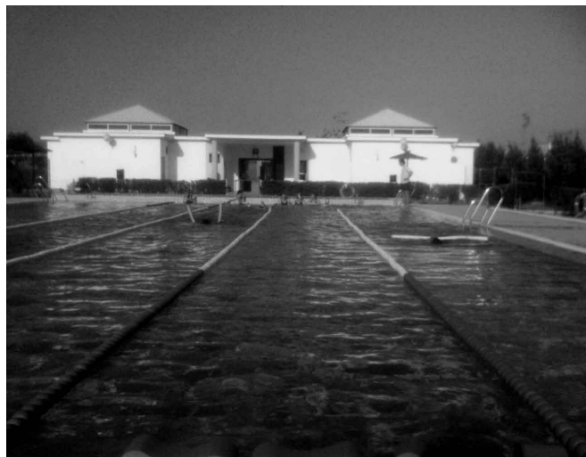
La piscina, dividida en seis calles, tiene 25 metros de largo por 21 de ancho.