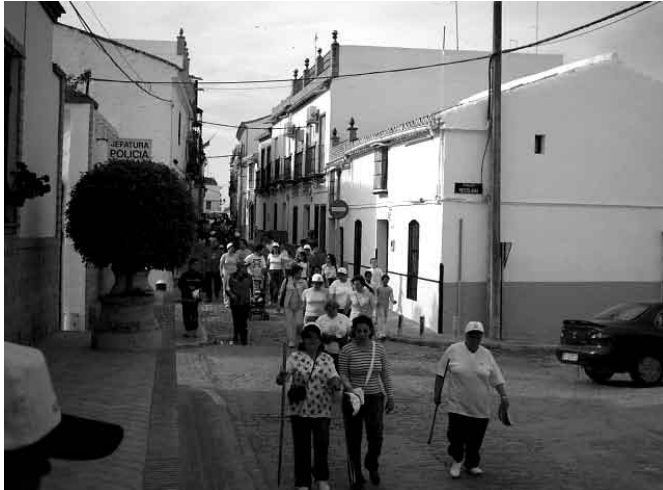
La presente edición de la carrera contó con la participación de numerosos saltereños.