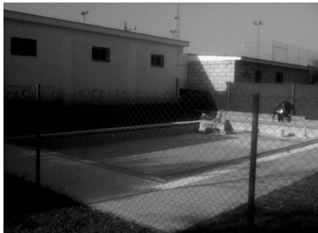
La piscina municipal cuenta también con unas instalaciones apropiadas para los más pequeños.

La piscina se ha convertido en uno de los principales focos de atracción de nuestro entorno