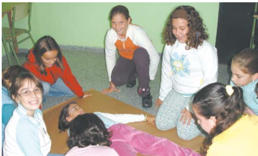
Los alumnos disfrutaron de las actividades llevadas a cabo por el Ayuntamiento.

Por otra parte, durante el pasado mes de noviembre, con motivo de las actividades que se celebran en conmemora-