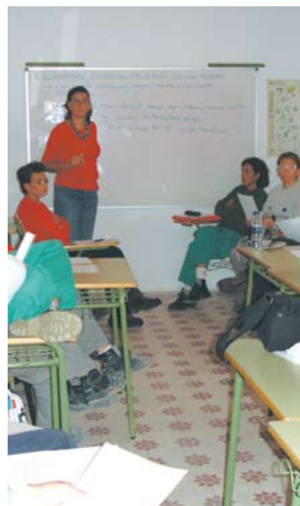
Alumnas del Taller de Empleo 'El Chorrillo'.

En noviembre, se llevaron a cabo numerosas actividades, como un taller de empleo, un curso de autoestima y las III Jornadas de Violencia de Género