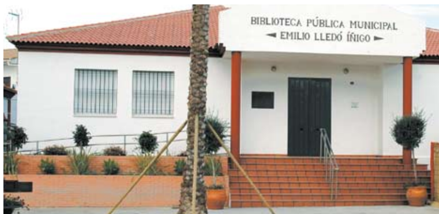
Los talleres de animación a la lectura se impartirán en la biblioteca municipal.

Curso de iniciación a la Informática (09:30 - 11:30 horas) Lugar: Casa de la Cultura. Taller de Animación a la Lectura (11:30 - 13:00 horas) Lugar: Biblioteca Emilio Lledó. Taller de Manualidades (16:00 - 19:00 horas) Lugar: Hogar del Pensionista.