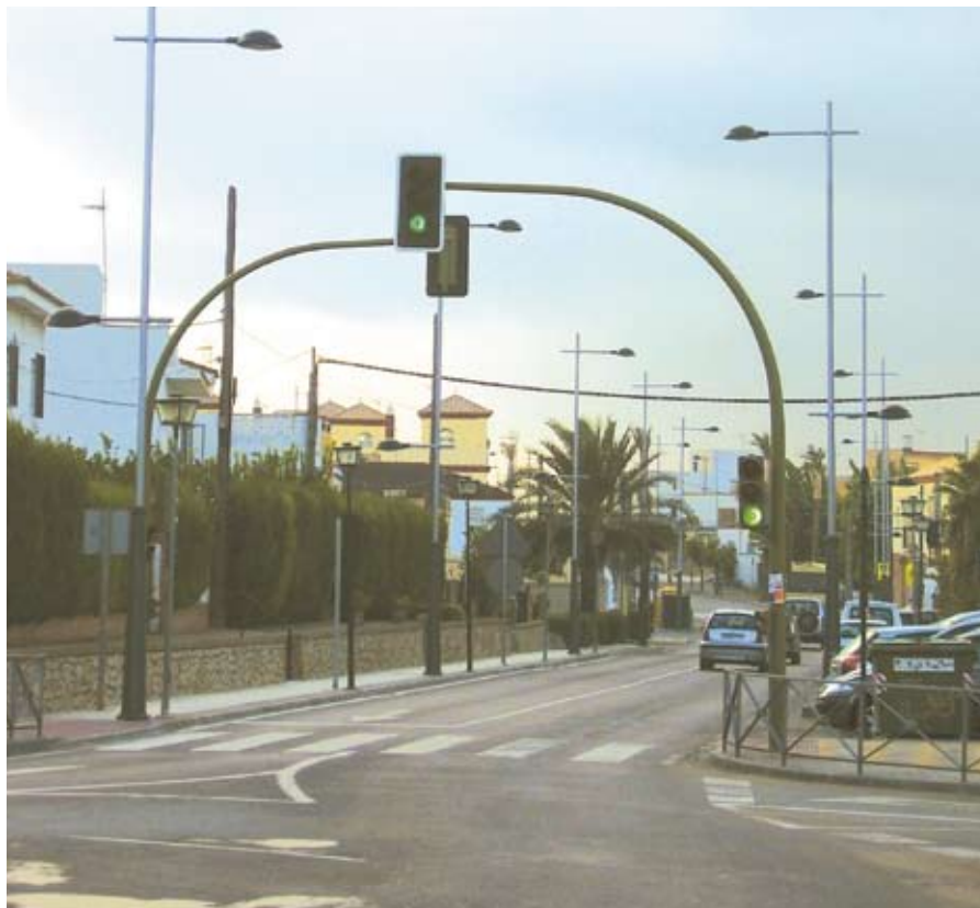
La nueva iluminación de la travesía ha contado con un presupuesto de casi 200.000 euros.

Para llevar a cabo esta ambiciosa obra, la Administración Local ha puesto en marcha un plan de remodelación integral en el que ha invertido un total de 100.800 euros. En concreto, la calle