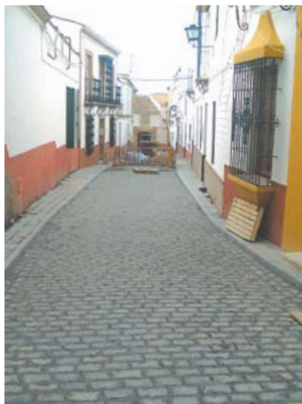
La emblemática calle Méndez Núñez.

Méndez Núñez contará con un nuevo alcantarillado y nuevos sistemas de saneamiento. Asimismo, esta vía se reformará con la instalación de un nuevo acerado y adoquinado, todo ello con el único objetivo de hacer digna una de las principales accesos de la localidad. Las obras, además, están prácticamente finalizadas, como puede apreciarse en la imagen.