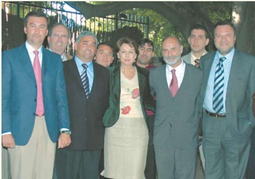
En la imagen, la ministra de Fomento tras la presentación del nuevo Plan de ampliación de Cercanías.

En total, la nueva línea contará con 32 kilómetros de recorrido en los que se modificará el trayecto Sevilla-Huelva, que será adaptado para el nuevo servicio.