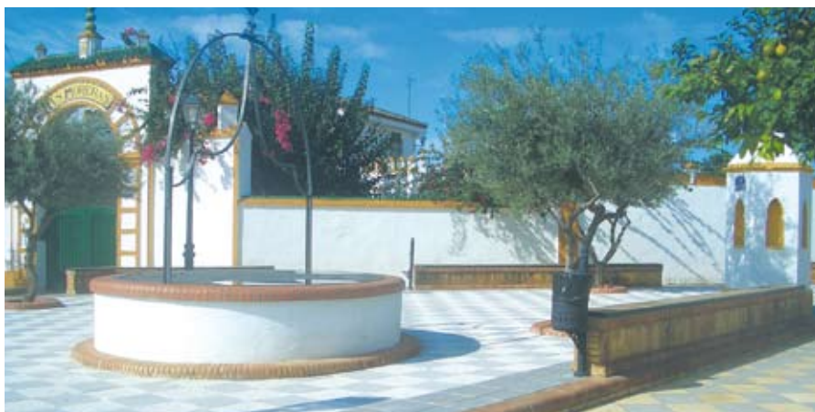
Plaza del Pozo.

Éste último aspecto, el embellecimiento de las infraestructuras públicas de Salteras, también ha sido una prioridad del Ayuntamiento en el caso de la Plaza de las Moreras, en la que se ha conseguido crear una plaza dotada con contenedores soterrados de recogida selectiva de basura, vegetación, farolas, bancos, papeleras y una fuente donde antes sólo había un solar con ocho árboles y un mobiliario bastante deteriorado.