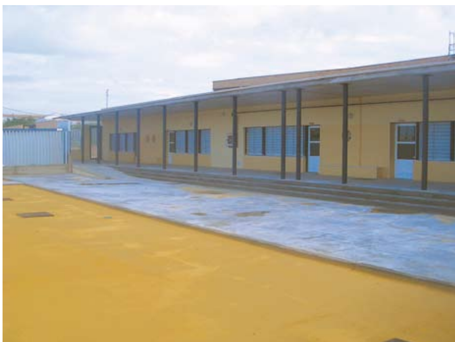
El nuevo colegio abrirá sus puertas en los próximos meses.

Uno de los hitos más destacados para todos los saltereños será, sin lugar a dudas, la próxima apertura del nuevo colegio, un importantísimo proyecto que hará que Salteras cuente con dos centros educativos. El avanzado estado de las obras