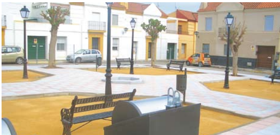
Intervención en la Plaza de las Moreras.

Otro de los focos de actuación del Ayuntamiento de Salteras han sido las plazas más emblemáticas de la localidad, cuya presencia, por su importancia, no puede dejarse de lado. En este sentido, la Plaza del Humilladero (conocida como Plaza del Pozo Grande) también ha sido reformada con el objeto de regular de forma más eficiente el acceso al casco antiguo y embellecer el aspecto general de éste enclave tan importante para la localidad. Para ejecutar esta obra el Ayuntamiento ha destinado un presupuesto de 18.000 euros.