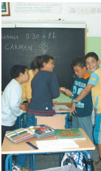
Los alumnos participaron activamente en las jornadas.