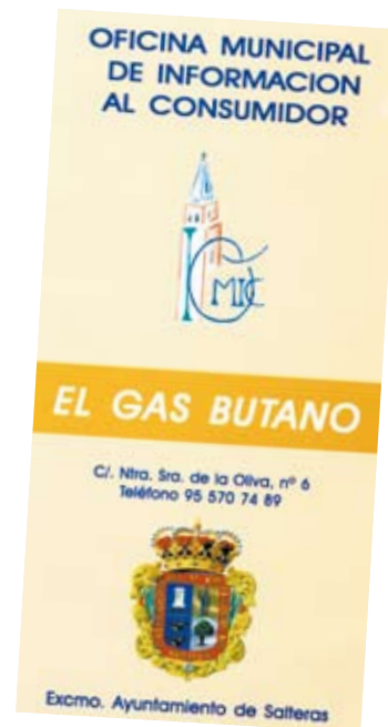
Portada del tríptico que repartirá el Ayuntamiento.

Finalmente, cabe destacar que la Oficina del Consumidor llevará a cabo una serie de talleres fruto de la firma de un convenio entre el Ayuntamiento y la Unión de Consumidores de Sevilla en los que se informará sobre diversos temas que se darán a conocer en los próximos meses.