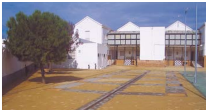
El patio de la zona de primaria, completamente restaurado.