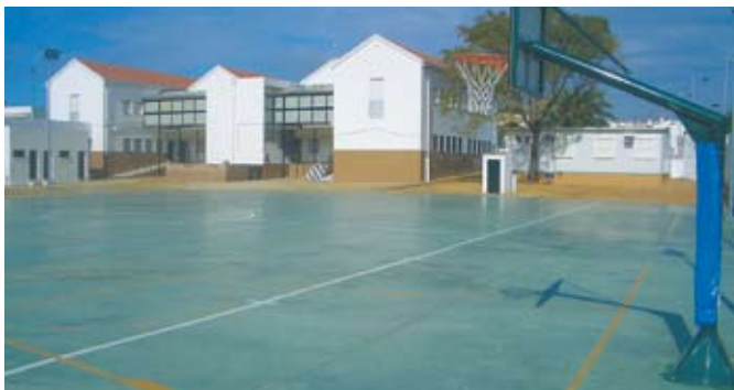
Aspecto que presenta la nueva pista polideportiva del Colegio.