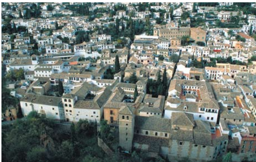
Las personas mayores pudieron disfrutar de un placentero viaje a Granada.

Para tan fausta ocasión, se ha organizado una cena especial en la que ellos fueron los principales protagonistas. Además, se les ha invitado a un viaje a Granada durante todo un fin de semana y a una visita cultural a Sevilla, entre otras actividades.