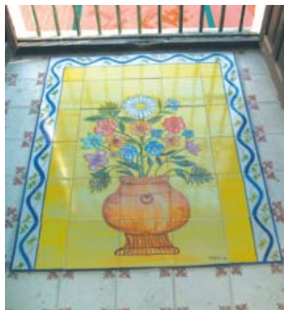
Muestra del Taller de Cerámica.

En concreto, el taller de electricidad se impartirá en la nave municipal de la calle Don Criterio, los lunes, miércoles y jueves de 16 a 18 horas. Por su parte, los de Cerámica se llevarán a cabo en la Casa de la Cultura los