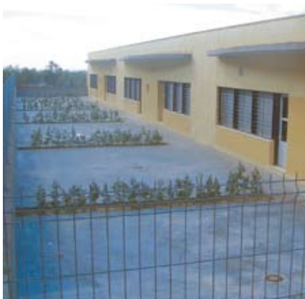
Acondicionamiento exterior del nuevo colegio.

El Ayuntamiento de Salteras está llevando a cabo dos grandes proyectos que, sin lugar a dudas, constituyen una de las obras más importantes de los últimos años en materia de infraestructuras educativas.