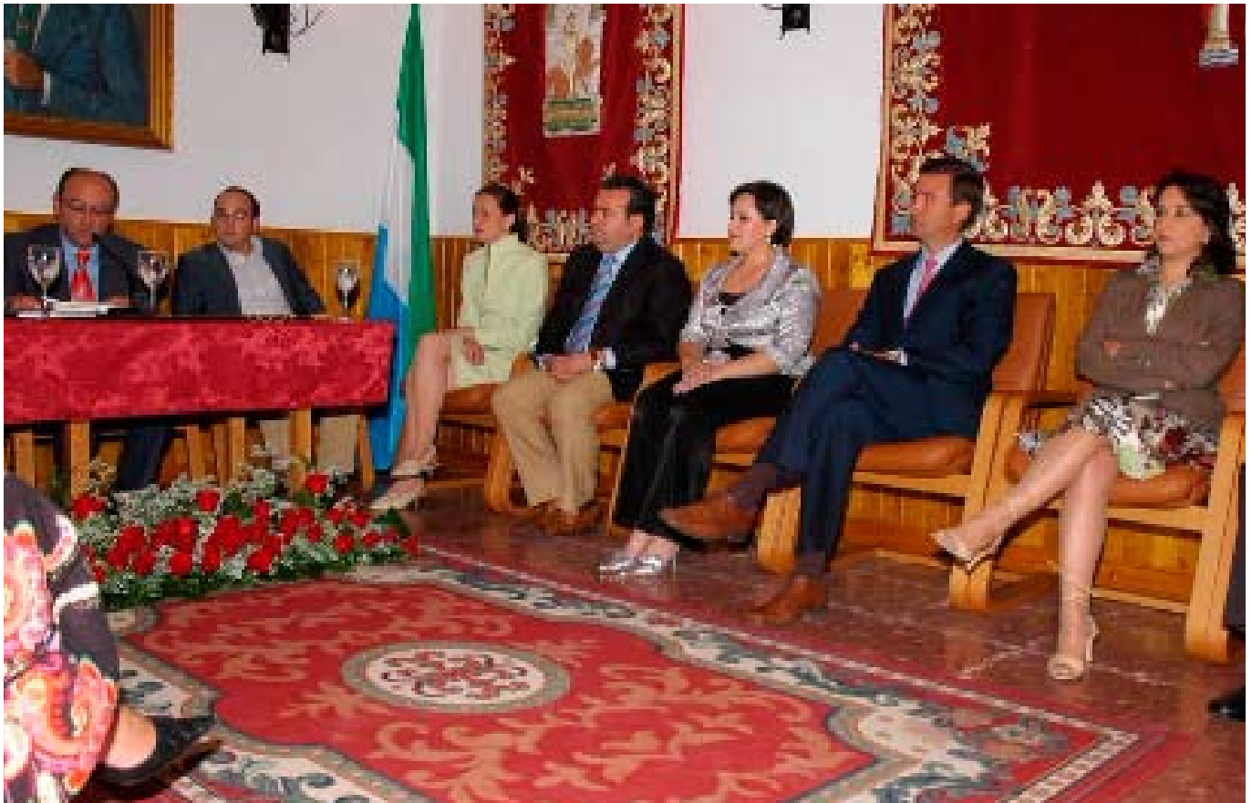
Integrantes de la corporación municipal de Salteras durante el acto de investidura.